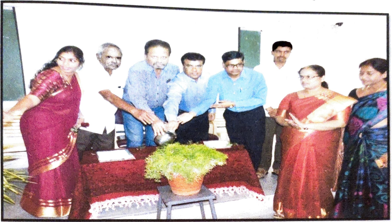
Paper Clippings: Nagarika Newspaper 03-02-2019