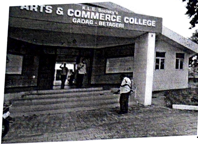
Testing for COVID