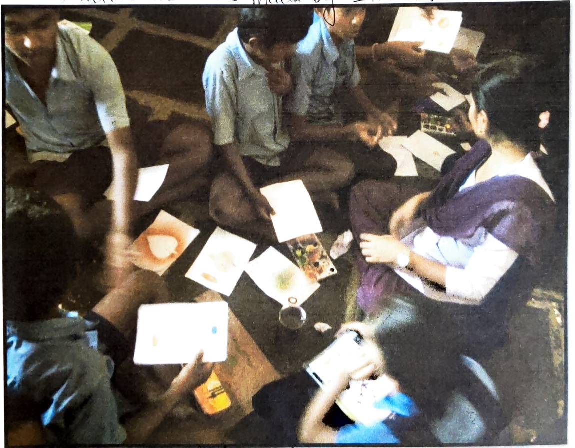
Home-Science students conducting classes

AM CO-COORDINATOR KLE'S Arts & Commerce College GADAG