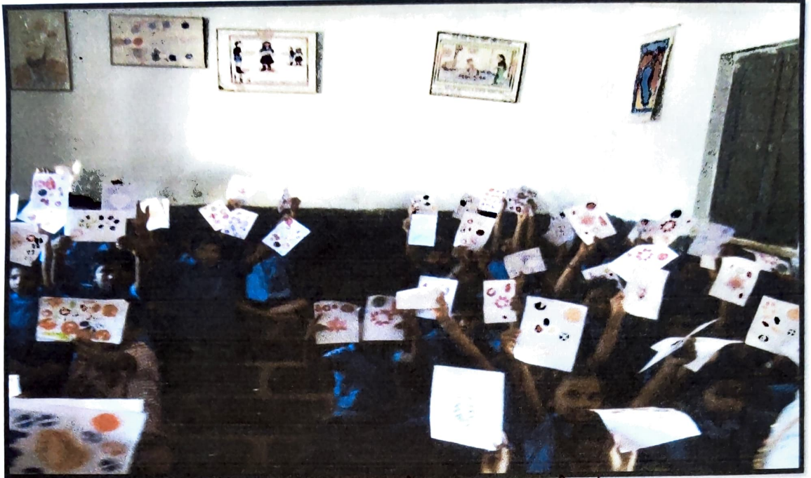
Creative activities made by students