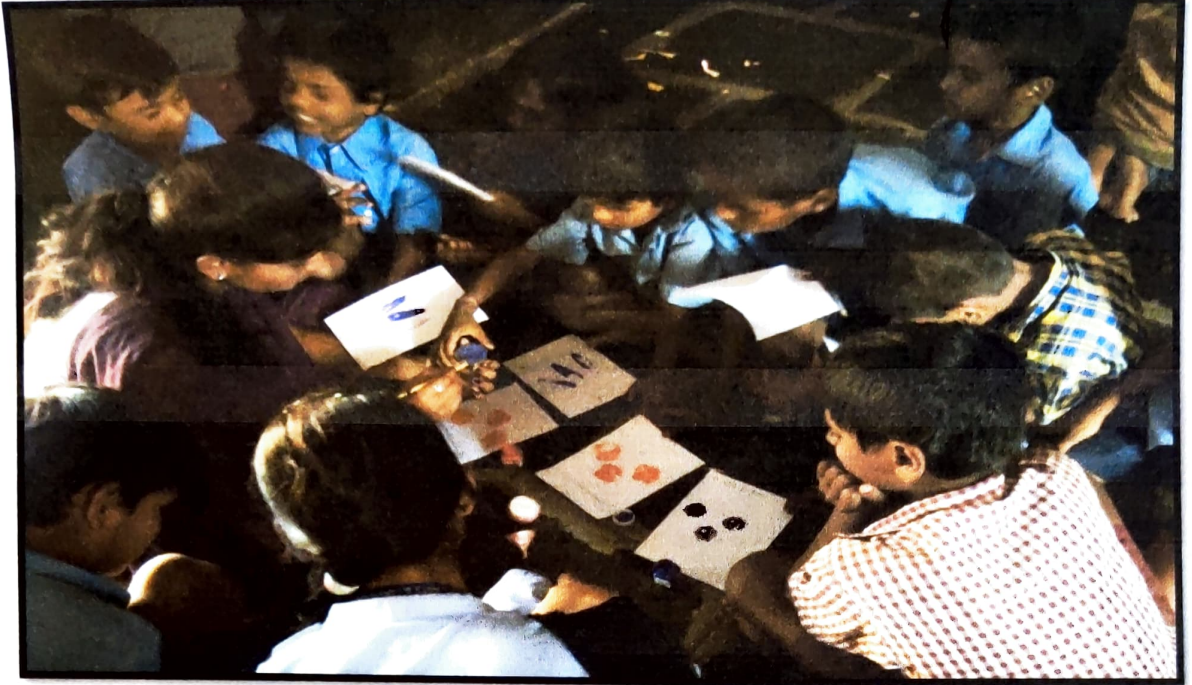
PAPER CLIPPING: NAVODAYA NEWS PAPER-05-02-2017

KLE Societies Arts and Commerce college Gadag. Students involved in Block Printing