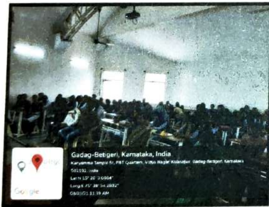
Girl Students attended Self Defense Workshop