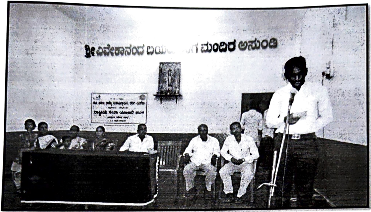
NEWS CLIPPINGS: NAVODAYA NEWS PAPER ON 04-03-2017