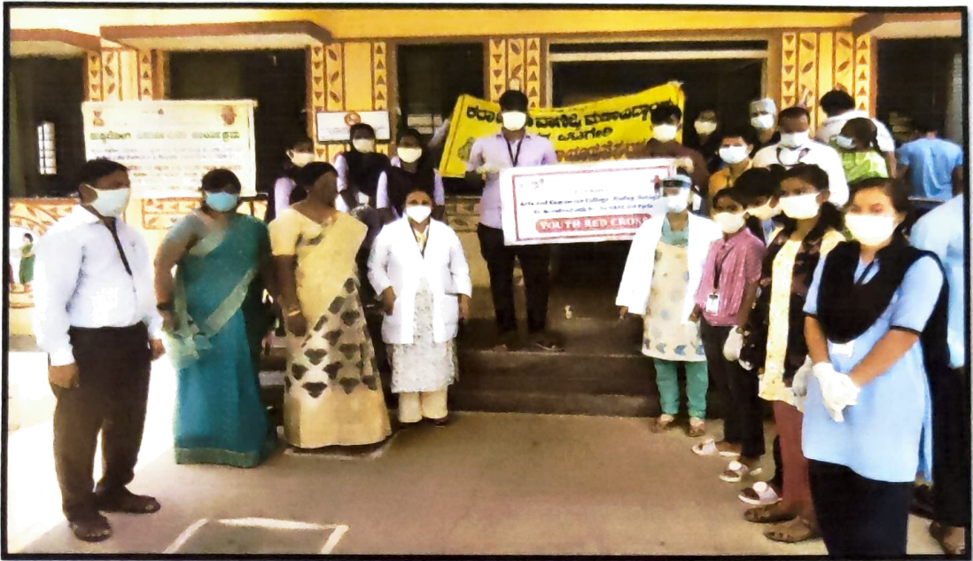
Press Report: Vijaya Vani Newspaper 27-4-2021

Staff, Students with Doctors of Betageri Primary Health Care Centre on 26-04-2021