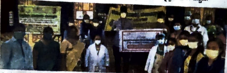
ಗದಗ: ಬೆಟಗೇರಿ ಪ್ರಾಥಮಿಕ ಆರೋಗ್ಯ ಕೇಂದ್ರದ ಕೋವಿಡ್-19 ಲಸಿಕಾ ಕೇಂದ್ರದಲ್ಲಿ ಕೆಲವು ಸಂಸ್ಥೆಯ ವಿದ್ಯಾರ್ಥಿಗಳು ಕೋವಿಡ್-19 ಮಾರ್ಗಸೂಚಿಗಳ ಬಗ್ಗೆ ಜಾಗೃತಿ ಮೂಡಿಸಿದರು.