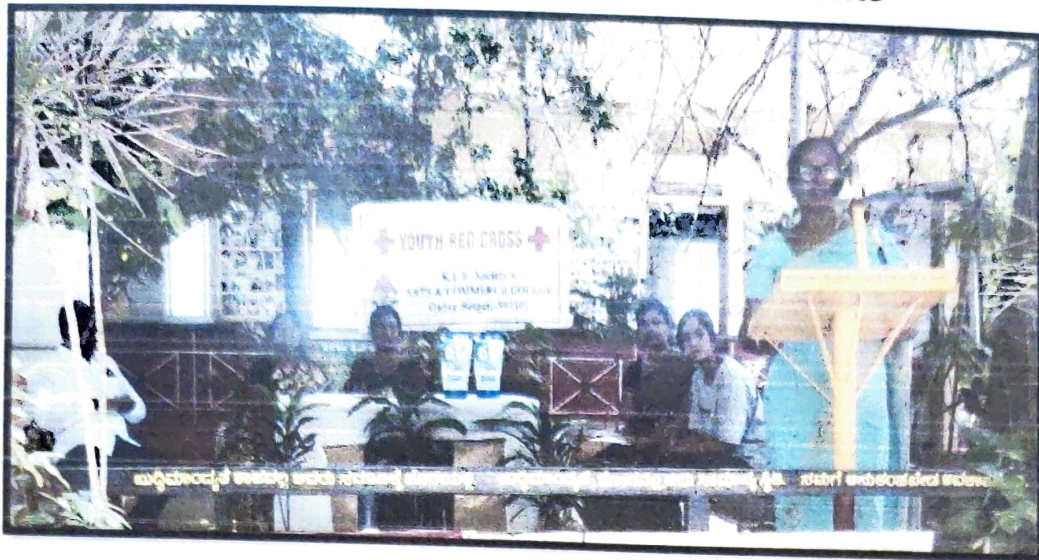
Donation of Hand Sanitizers to the School